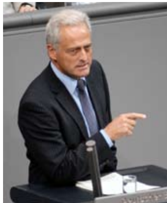
Peter Ramsauer im Bundestagsplenum

Die Bundeskanzlerin hat in ihrer Regierungserklärung von den Chancen gesprochen, die uns das NATO-Bündnis in den nunmehr 60 Jahren seines Bestehens bietet. Dies ist mit Nachdruck zu unterstützen. Ja, die NATO ist eine große Chance für Deutschland - Deutschland und Europa brauchen dieses Bündnis. Deutschlands Interessen lassen sich ohne die NATO nicht schützen: Frieden in Europa, Freundschaft mit unseren Nachbarn, Sicherheit für Handel und Sicherheit für Reisen. In anderen Staaten gehören die nationalen Interessen zum parteiübergreifenden Konsens. In Deutschland ist das leider nicht ganz so. Hier steht oft schon allein der Begriff „nationale Interessen“ im Geruch politischer Unkorrektheit.