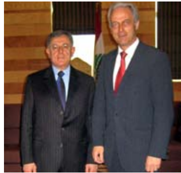
Dr. Peter Ramsauer mit dem libanesischem Ministerpräsident Fouad Siniora

sich lebhaft an seine vielfachen Begegnungen mit Franz Josef Strauß erinnerte und Ramsauer als dessen Nachfolger im Amt des Landesgruppenvorsitzenden mit einem Essen in seinem Privathaus ehrte.