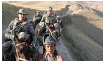
Unterwegs mit dem Maultier in Tawa Tash

rung, die im Februar gemeinsam mit der internationalen Staatengemeinschaft in London ausgearbeitet worden war und deren Umsetzung in den nächsten Monaten im Mittelpunkt stehen wird. Mit diesem neuen Konzept sollen die Grundlagen dafür