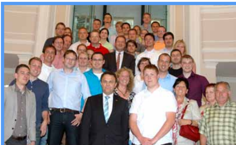
Dr. Hans-Peter Friedrich begrüßte am Montag 50 Teilnehmer der CSU-Akademie in Berlin. Die CSU-Landesgruppe hatte die Nachwuchspolitiker in die Hauptstadt eingeladen. Sie führten unter anderem Gespräche bei der CDU und mit dem BDI.