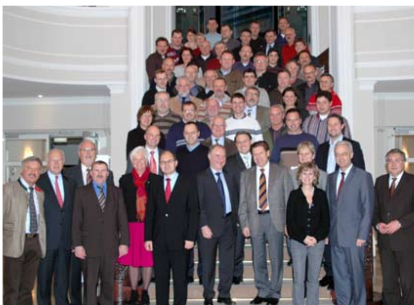
Führungskräfte der Freiwilligen Feuerwehr zu Besuch in der Bayerischen Landesvertretung

und Katastrophenschutz. Sie wird die Initiative der Bayerischen Staatsregierung gegenüber dem SPDgeführten Bundesverkehrsministerium nachhaltig unterstützen, die eine Ausnahmeregelung für Fahrzeuge bis zu einer Gesamtmasse von 4,25 t vorsieht.