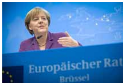
Pressekonferenz zum EU-Gipfel mit Bundeskanzlerin Dr. Angela Merkel

neue Schulden überschritten, so wird es einen Automatismus zu einem Defizitverfahren geben. Lediglich mit Zustimmung einer qualifizierten