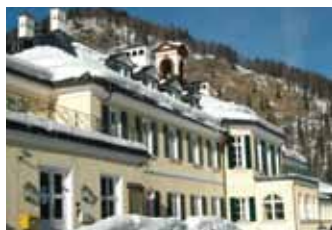
Hanns-Seidel-Stiftung in Wildbad Kreuth

Auf dem Programm der Tagung steht auch der Dialog mit hochrangigen deutschen und internationalen Repräsentanten aus den Bereichen Wirtschaft, Finanzmarkt, Rechtswissenschaft und Politik. Als Gäste wird die Vorsitzende der CSU-Landesgruppe, Gerda Hasselfeldt, beispielsweise den niederländischen Ministerpräsidenten Mark Rutte und den Präsidenten des Bundesverfassungsgerichts, Prof. Dr. Andreas Voßkuhle, begrüßen.